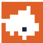
TABELLA DEI PARAMETRI OBIETTIVI PER PROVINCE E CITTA' METROPOLITANE AI FINI DELL'ACCERTAMENTO DELLA CONDIZIONE DI ENTE STRUTTURALMENTE DEFICITARIO